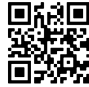
QR Code ประมวลภาพการประชุม