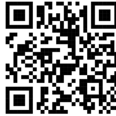
QR Code ประมวลภาพการประชุม